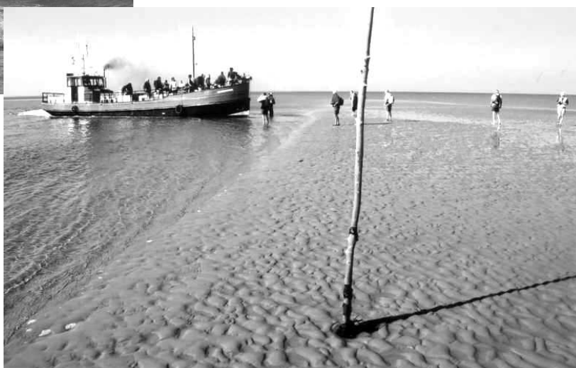
Excursie Rottumeroog september 2006