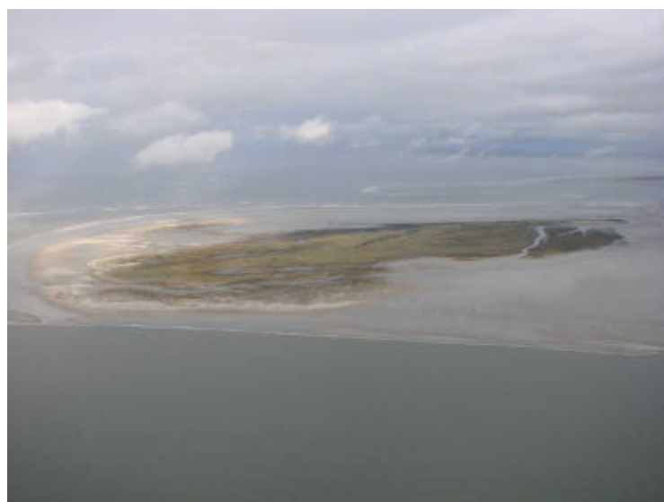
Linkerkolom: noorzeezijde Oog, de doorbraak van 1998 op Oog, bebouwing op Plaat