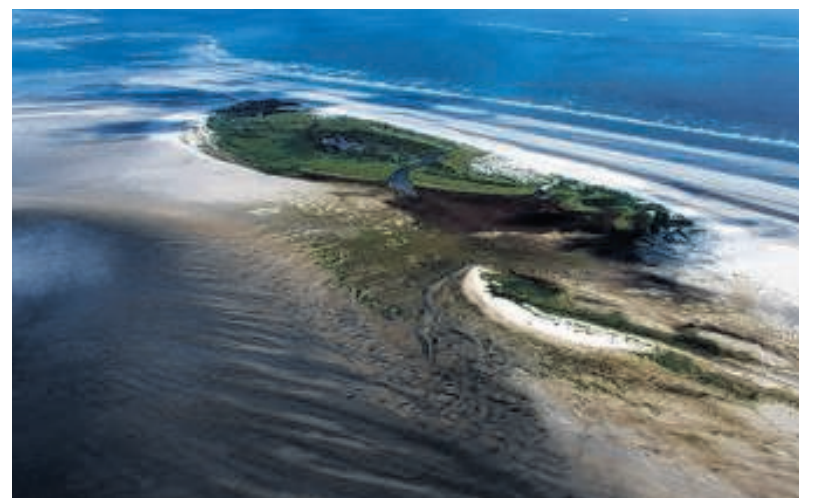
Het eiland Rottumeroog, gezien vanuit de lucht, met rechtsboven in beeld de Noordzee en links onder de Waddenzee.