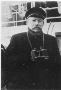
Een van de vroegere voogdhuzen.

„Rottumeroog” zongen wij uit met lange halen en met de nadruk waarmee we ook de tafels van vermenigvuldiging plachten te beëindigen. Niet omdat een sterk provinciaal chauvinisme ons daartoe verleide, nee, we jodelden het haast uit terwijl we met halzen als giraffes over de ouderwets-hoge vensterbanken spiedden. Want daar zagen we Rottum, zoals we het eiland doorgaans noemden, gepersonifieerd. Aanschouwelijk onderwijs was er niet.