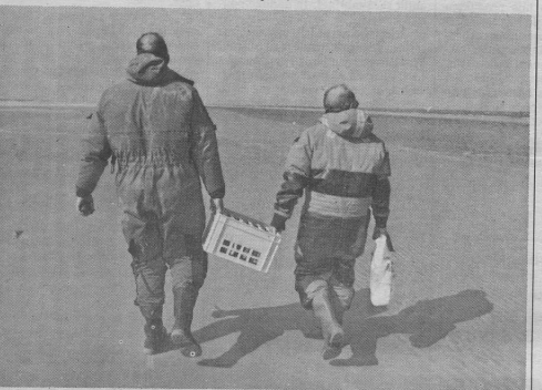
De mannen fan 'e K.N.Z.H.R.M. hawwe oan alles tocht; sels oan it kratsje bier foar de sneontein