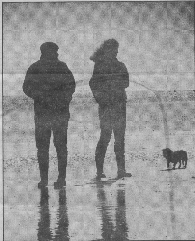
■ Met de hond langs de vloedlijn.